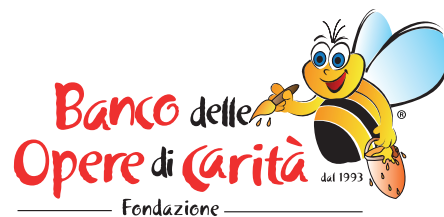
Fondazione Banco delle Opere di Carità Onlus