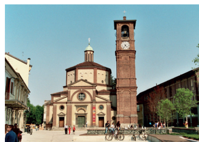
Legnano (MI), Basilica di San Magno

re parametri e criteri omogenei per l'accesso ai servizi, dall'incremento della conoscenza e dello scambio tra gli enti che favorisce modalità di lavoro maggiormente condivise. Tra i punti di debolezza si rilevano difficoltà nella composizione dei diversi interessi di cui ciascun comune è portatore, complessità dei rapporti economici tra enti, lentezza nei processi decisionali e necessità di validazione nei singoli comuni di alcune decisioni assunte dall'organo di governo politico.