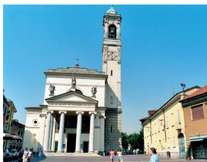
Rho (MI), Basilica di San Vittore