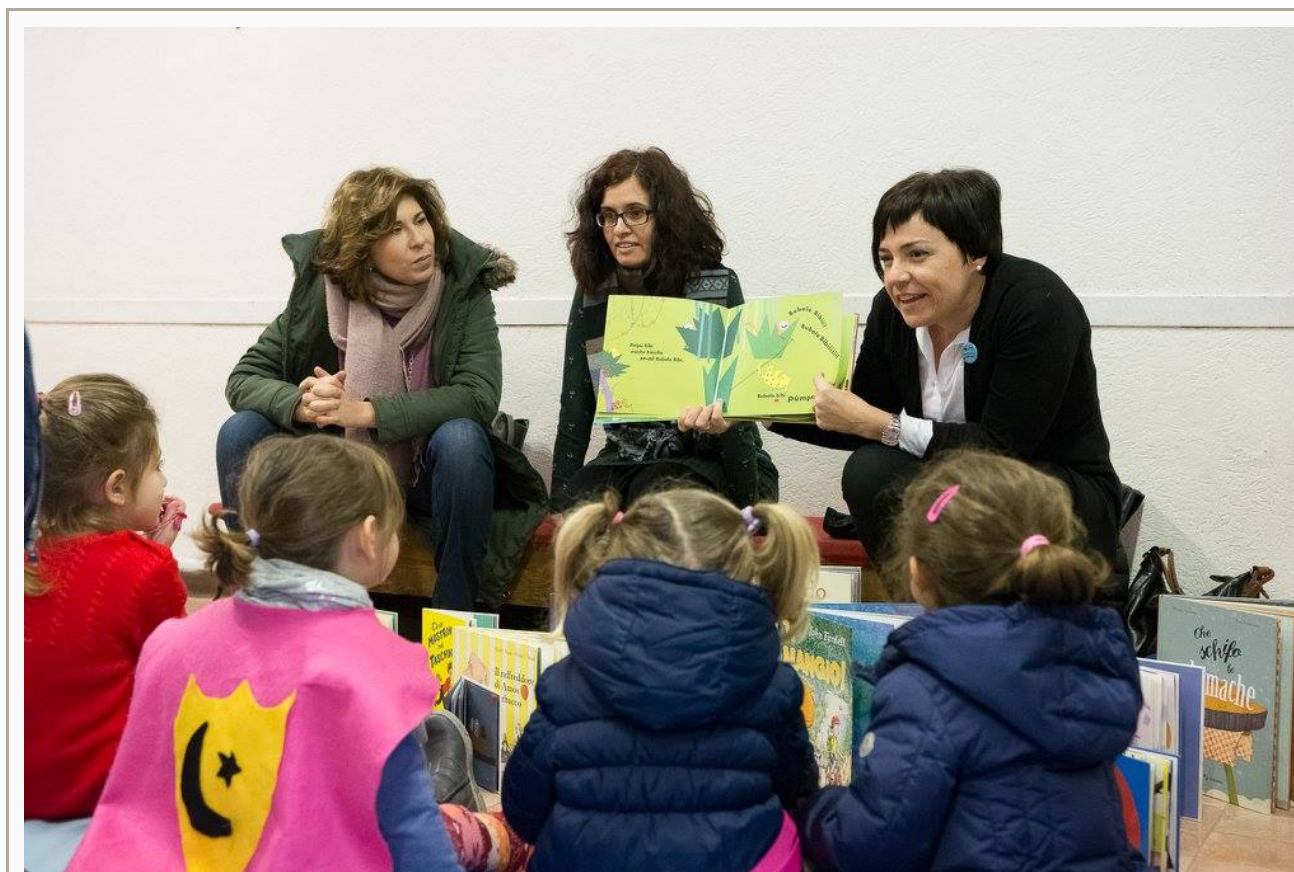
Pezzettini. Festival della lettura nella periferia romana (leggi anche Leggiamo per creare comunità di Patrizia Sentinelli)

È molto interessante rileggere oggi quella “Lettera”, soffermandosi anche sui tanti dati che raccoglie. Quelle statistiche raccontano molto dettagliatamente come nel nostro paese, in pieno boom economico, la scuola continuava a fare “strage di poveri”. Confrontando quei numeri con ciò che accade oggi, scopriremo che in un mondo radicalmente cambiato, resta invalicabile nel nostro paese il blocco a ogni ascesa e rimescolamento sociale .